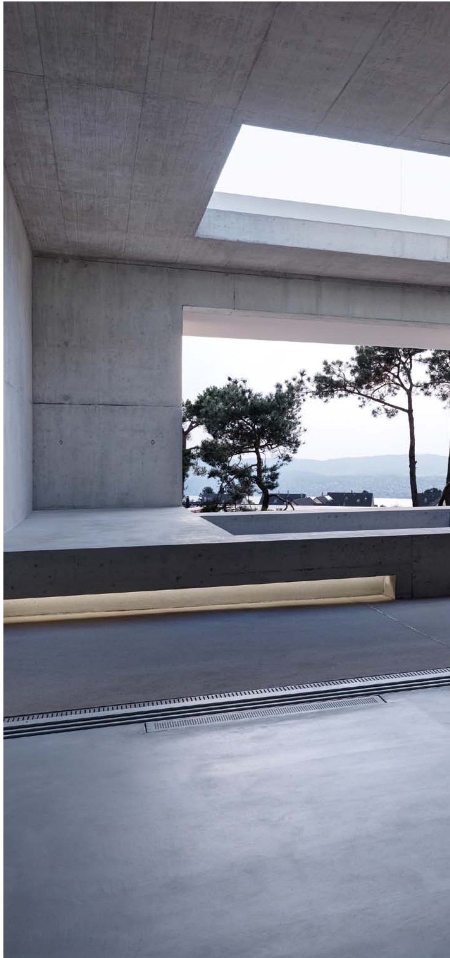
2 verandas, Switzerland. Architecture: Gus Wüstemann, Switzerland, Spain. 2012