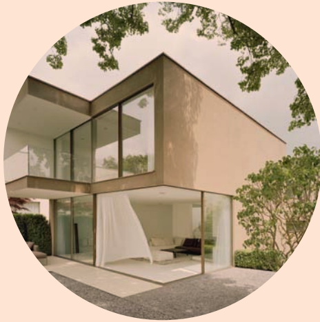
CLASSIC Sliding doors