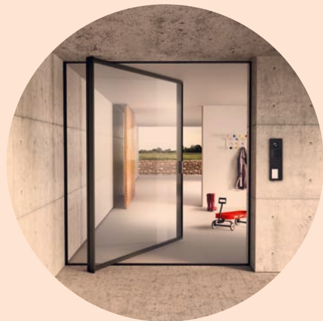
PIVOT Pivot door