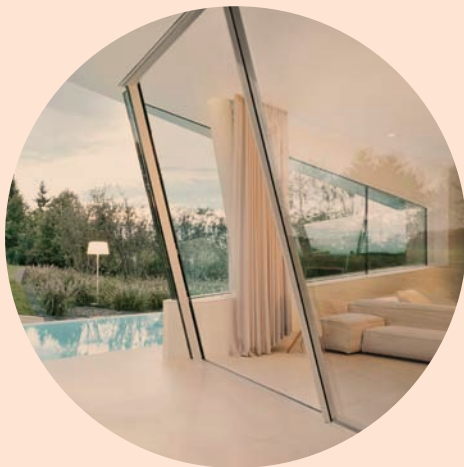
SLOPE Inclined sliding doors