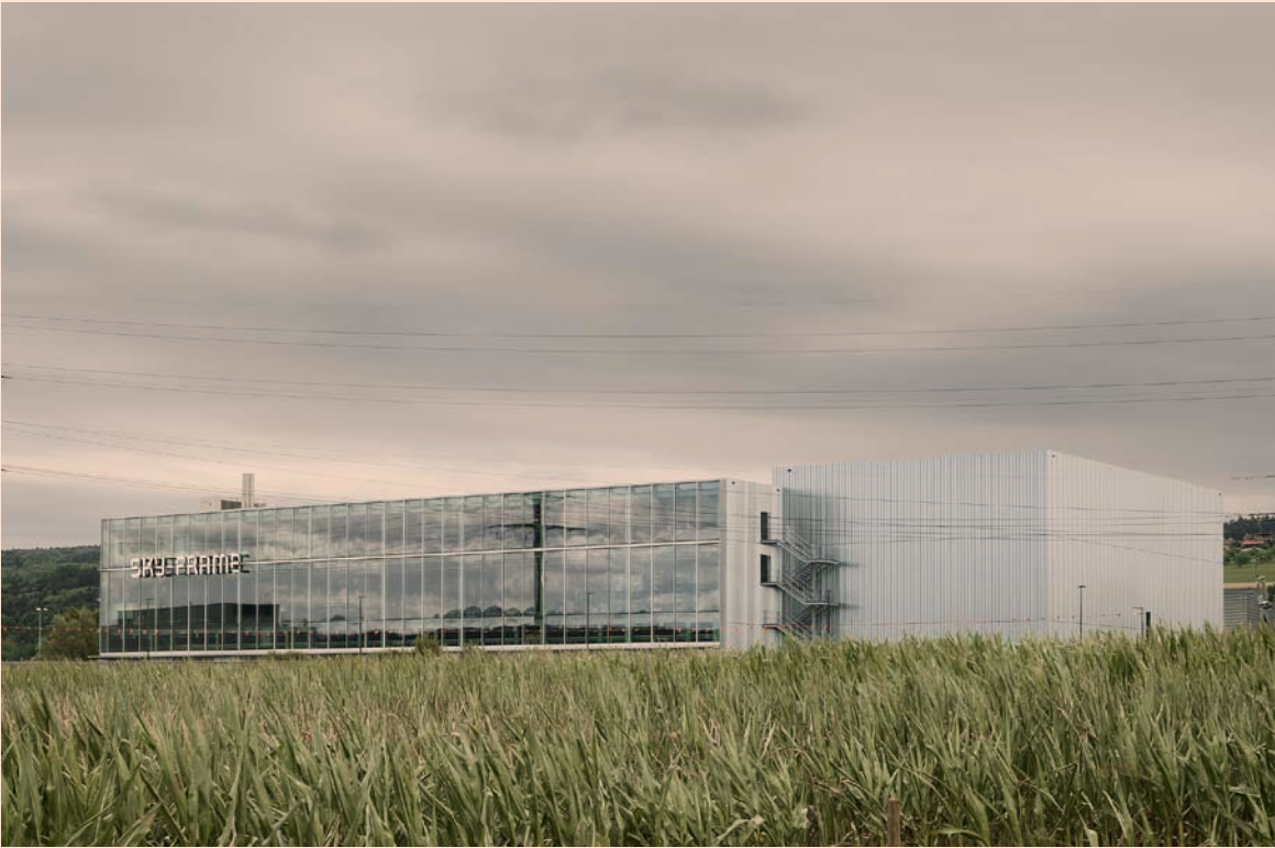
Sky-Frame Headquarters in Frauenfeld, Switzerland.