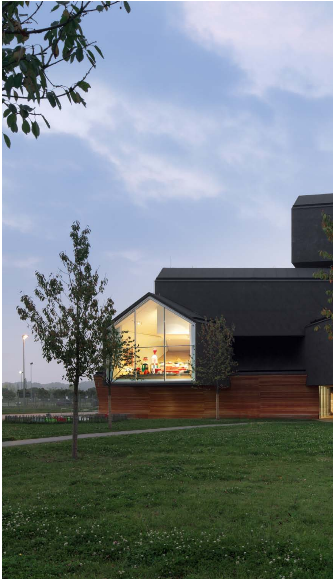
VitraHaus, Germany. Architecture: Herzog & de Meuron, Switzerland. 2010