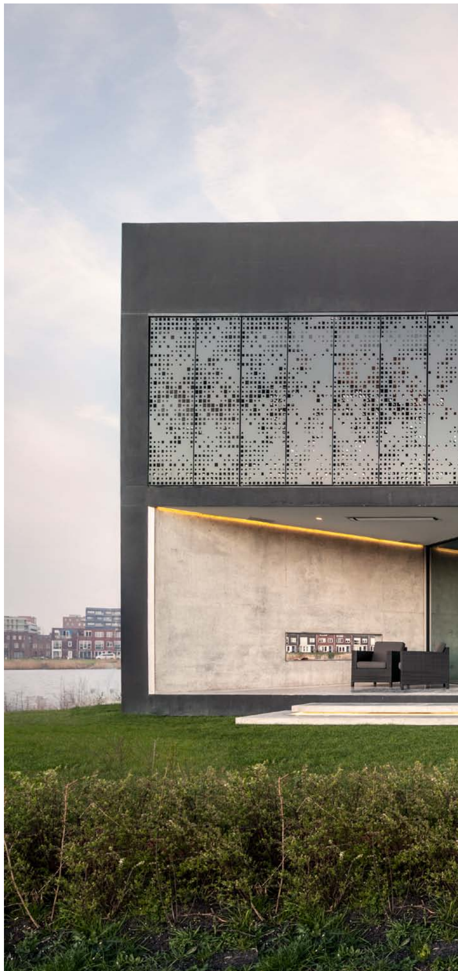
Villa Kavel 01, Netherlands. Architecture: Studioninedots, Netherlands. 2013