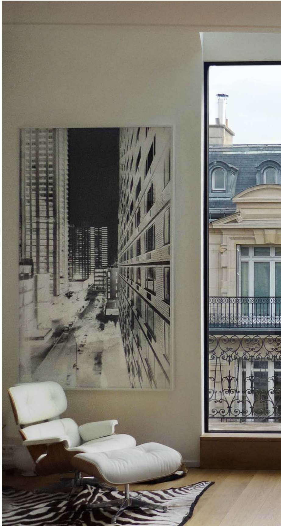
Renovation in Paris, France. Architecture: Etienne Herpin, France. 2009