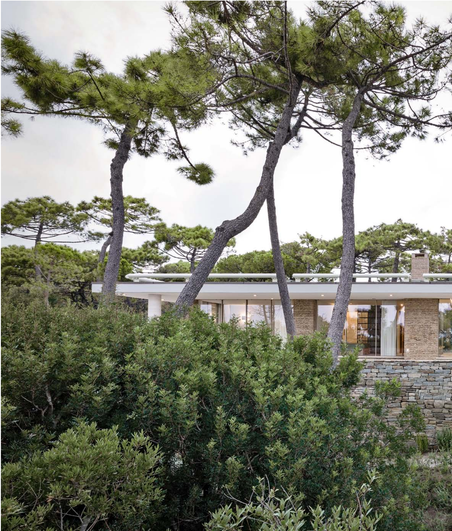
House in Roccamare, Italy.

Architecture: Architectures Générales, Sergio Cavero, Switzerland. 2015