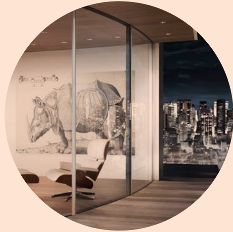
ARC Curved sliding doors