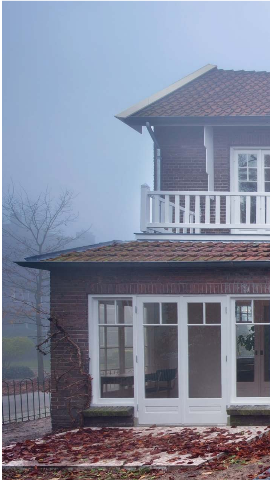
Villa in Utrecht, Netherlands. Architecture: Zecc Architects BV, Netherlands. 2010