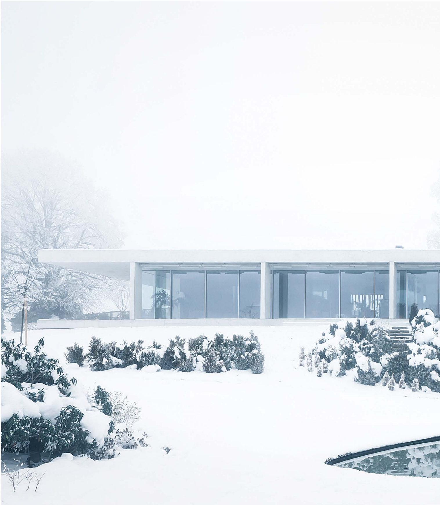
Villa in Appenzell, Switzerland. Architecture: Peter Kunz, Switzerland. 2010