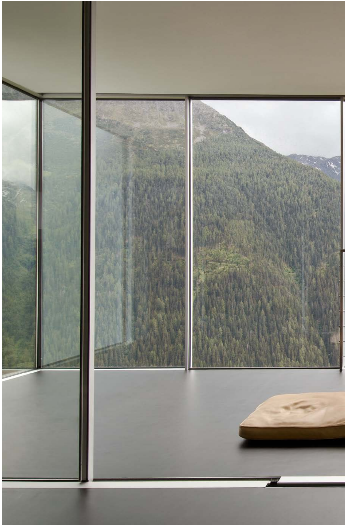
House in Guarda, Switzerland. Architecture: Roger Vulpi, Switzerland. 2006