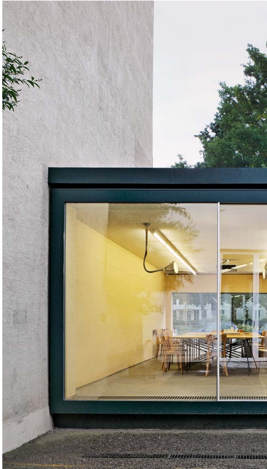
Herzog & De Meuron, Switzerland. Architecture: Herzog & de Meuron, Switzerland. 2008